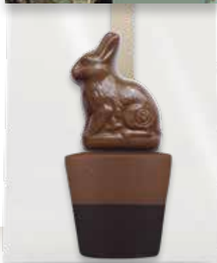
TRINKSCHOKOLADE HASE VOLLMILCH ZARTBITTER „Frohe Ostern!“