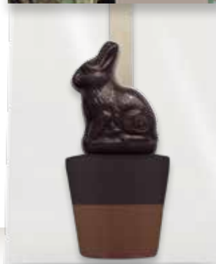
TRINKSCHOKOLADE HASE ZARTBITTER VOLLMILCH „Frohe Ostern!“