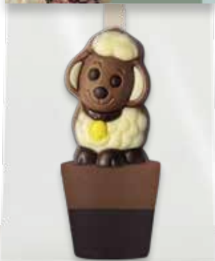
TRINKSCHOKOLADE SCHAF VOLLMILCH ZARTBITTER „Frohe Ostern!“